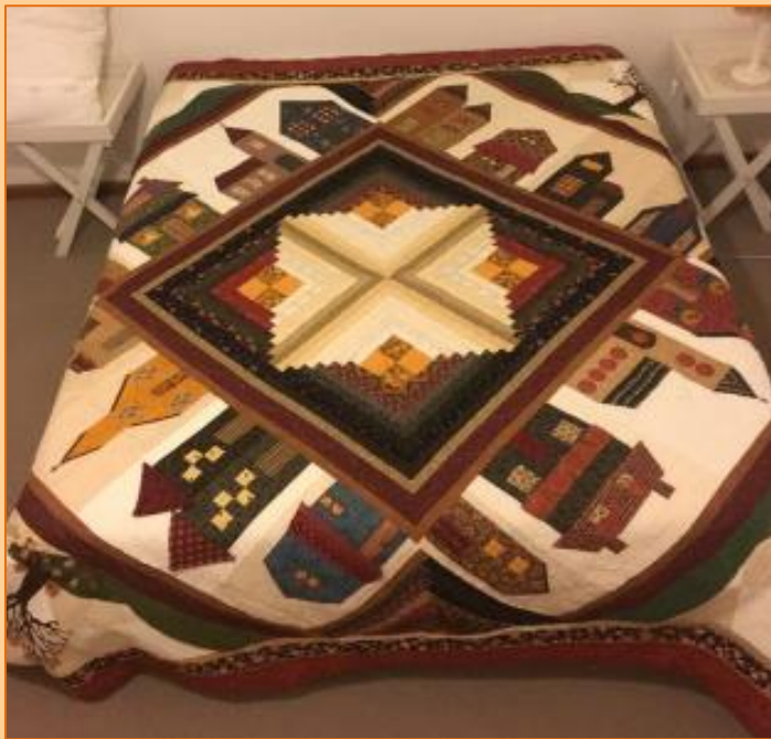
2019/2020 Kwilt deur die dames van Vivo/Dendron